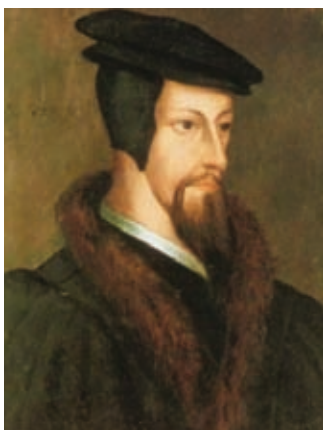
Johannes Calvijn (1509-1564)