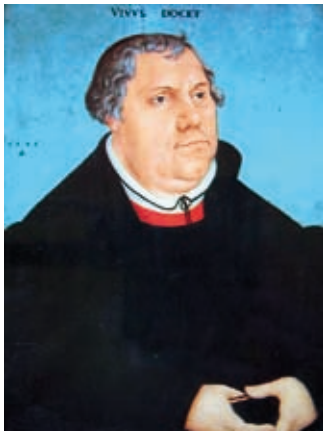
Maarten Luther (1483-1546)