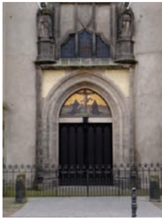
De deur van de kerk waarop Luther zijn stellingen spijkerde