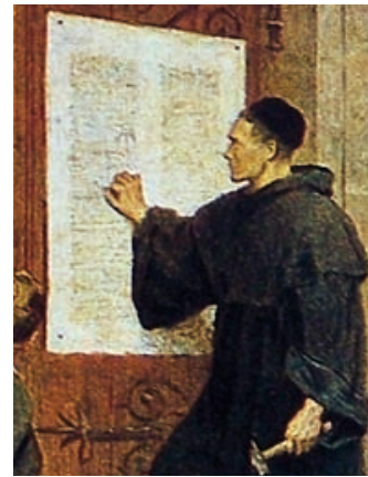
Luther laat zijn stem horen!