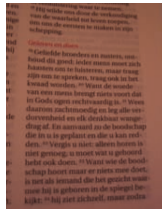
Hetzelfde stukje, maar dan uit de Bijbel in het Nederlands